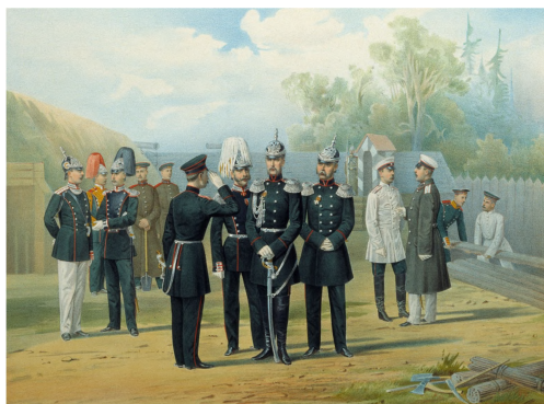
Рис. 1 – Лейб-гвардии саперный батальон на охране острога (с картины XIX века)

ли открыты с 1 мая 1917 г. Пенитенциарные курсы при Главном управлении мест заключения Минюста. «...На курсах будут преподаваться: общее законоведение, начала уголовного права, тюремоведение, уголовная политика и социология, тюремная гигиена и санитария, общие начала бухгалтерии, товароведение. Общее руководство взял ... начальник Управления профессор Жижиленко. В состав преподавателей курсов вошли: профессор С.Н. Гогель, И.П. Люблинский, П.А. Останкин, приват-доценты – М.М. Исаев, Д.П. Никольский, Э.Э. Понтович. Занятия будут проходить в кабинете Уголовного права при Петроградском университете» [8].